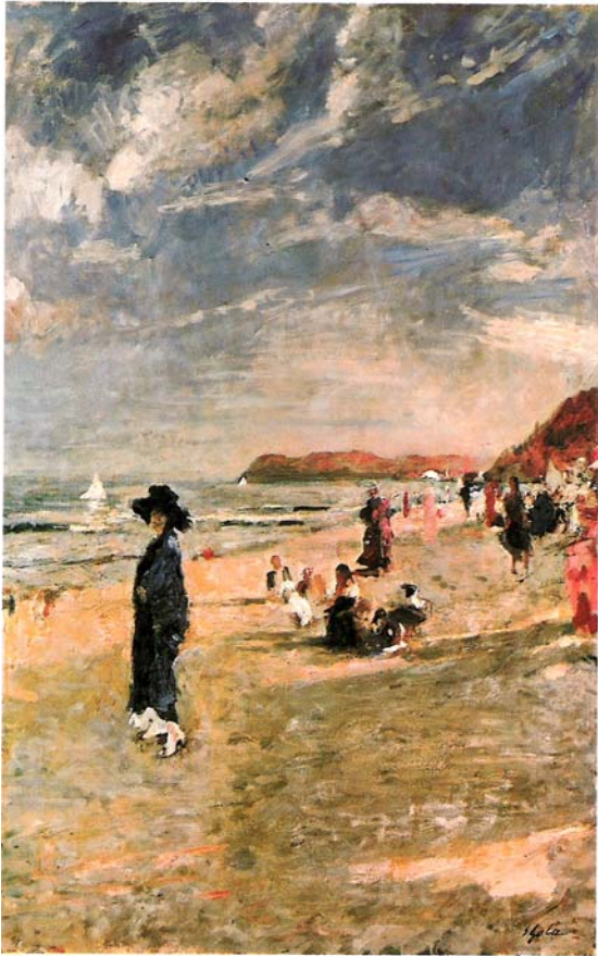
Emilio Gola (Milano, 1851-1923)