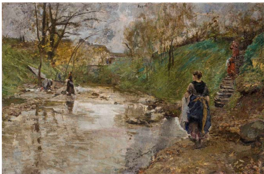
Emilio Gola (Milano, 1851-1923)

Lavandaie Olio su tela 65,5 x 117,5 cm (Galleria Bottegantica)