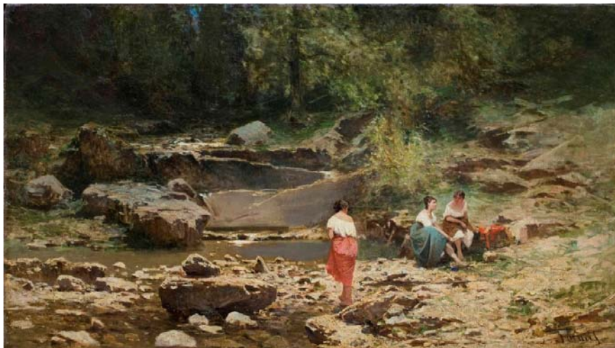
Achille Befani Formis (Napoli, 1832 – Milano, 1906)

Cannaregio (Venezia) Olio su tela 60 x 90,5 cm (Galleria Bottegantica)